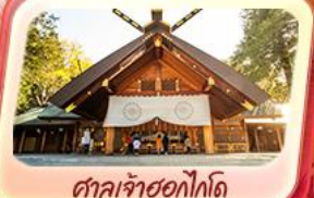
ศาลเจ้าซอกโกโต