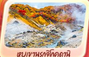
เขมเขานรชจิโกดากะนิ