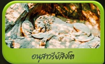
อนุสาวรีย์สิงโต

ฟรีด 11-18 มี.ย.69 / 26 มี.ย.-03 ก.ค. 69 / 22-29 ก.ค. 69 11-18 ส.ค.69 / 12-19 ก.ย. 69 / 24 ก.ย.-01 ต.ค. 69