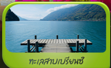
ทะเลสาบเบรียงซ์