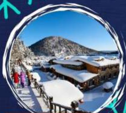
ขขขขขข+ขขขขขข