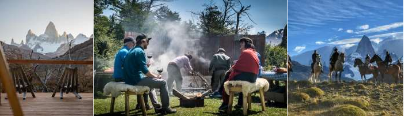
เที่ยง บริการอาหารมื้อกลางวัน แบบ BBQ พื้นเมือง

นำท่านร่วมจัดกิจกรรมตามเส้นทางชมวิวยอดเขาไฟท์ซรอย(Monte Fitz Roy) ทุกท่านจะได้ ขี่ม้า พายเรือคายัค และเดินป่า(ระยะใกล้ 1 ชม.) และรวมถึงได้ทาน BBQ พื้นเมืองรสเลิศ นำท่านขี่ม้า(Horse Riding) ประมาณสอง ชั่วโมง ชมวิวที่สวยงามระหว่างเส้นทาง จนกระทั่งเข้าสู่แคมป์ลากูนา ลิต้า (Camp Laguna Lita) ภายในแคมป์ลากูนา ลิต้า จะมีแอ่งที่น้ำใสราวกระจกสวยงามที่สุดแห่งหนึ่ง และที่พักสำหรับนักท่องเที่ยว