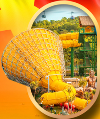
สวนน้ำ Hon Thom