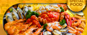
พิเศษเมนู ซีฟู้ดบุฟเฟ่ต์ 1 มื้อ เดินทาง มีนาคม 2569