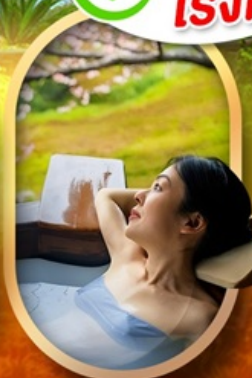
แช่บ่อนอนเซ็นญี่ปุ่น