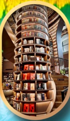
ร้านขายหนังสือ