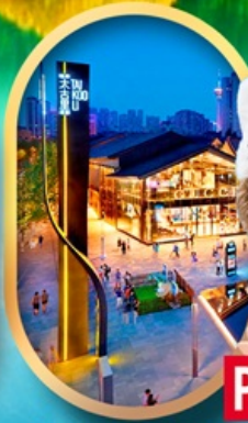
ถนนคนเดินไท่กู่หลี่