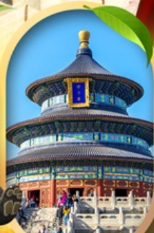
หอสังเกตการณ์เทียนถาน