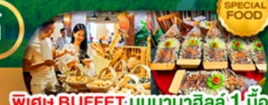
SPECIAL FOOD พิเศษ BUFFET; บันบานาฮิลล์ 1 มื้อ และ SEAFOOD BOAT เดินทาง มี.ค. - ต.ค. 69