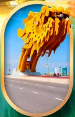
สะพานมังกรคานัง