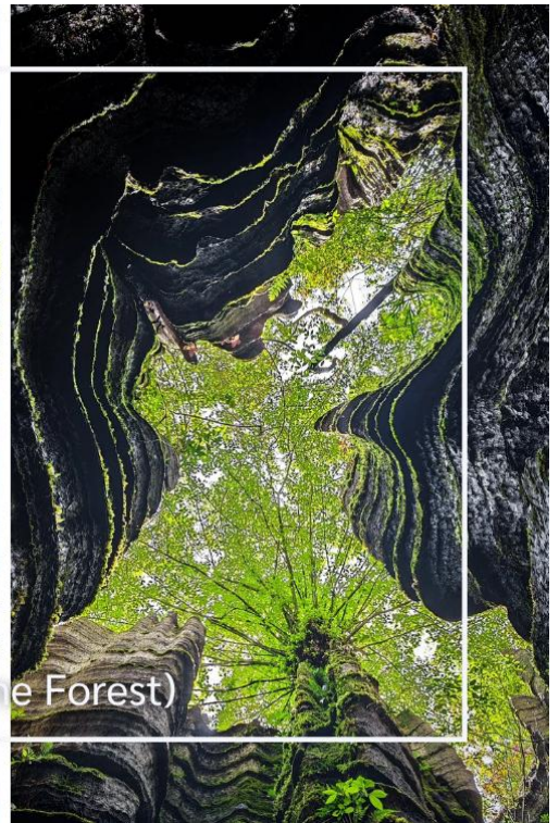
ป่าหินโซบู่ยาสโตนฟอเรสต์ (Suobuya Stone Forest)