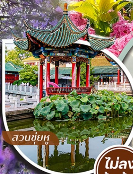
สวนชื่อยุ