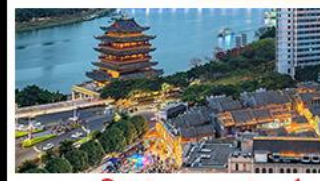
ถนนคนเดินสามตรอกสองซอย