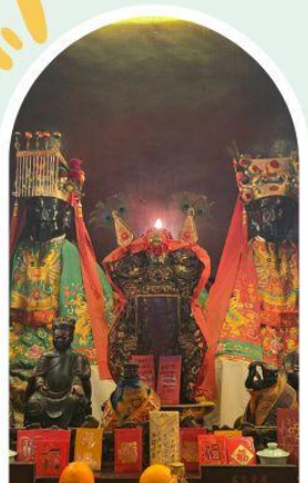
วัดหมิ่นโหมว