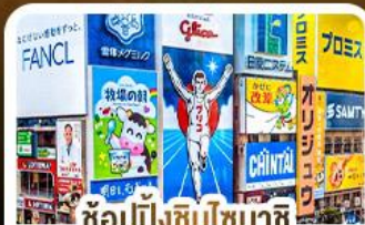
ช้อปปิ้งชินโซบาชิจิ