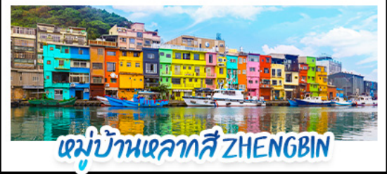
หมู่บ้านหลากสี ZHENGBIN