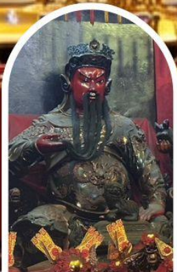
วัดกวนไท่ ขอเทพเจ้ากวนอู ความซื่อสัตย์ เงินทอง ธุรกิจมั่นคง