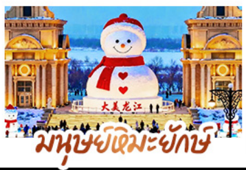
มนุษย์หิมะยักษ์