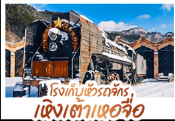
โรงเก็บข้าวรถจักร เชิงเต้าเขोजือ