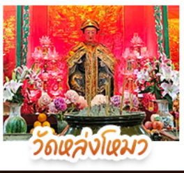
วัดเล่งโง้ว

โถ้โถ้ มั่งรรางพึกแถมสู่ TOP OF PEAK • ซ้อมปั้งจุใจมก และ CITYGATE OUTLAETS • มั่งกระช้านองปั้ง สักการะพระใหญ่เทียนถาน • จอพรเจ้าแม่หล่งโหมว มั่งงอง 5 มั่งกร ให้ประสพควมสำเร็จในทุกๆ ด้า