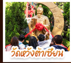
วัดต้งต้าเซียง