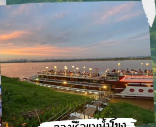
ล่องเรือแม่น้ำโขง