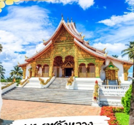
พระราชวังหลวง