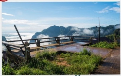
ดอยฟ้าฮ่า