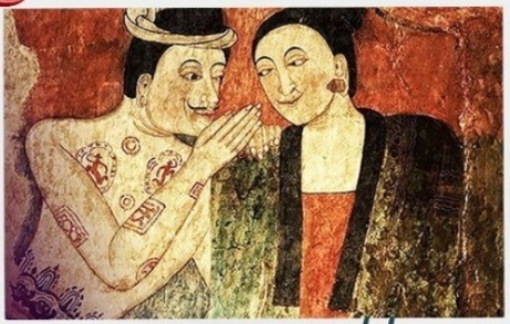
จิตรกรรมฝาผนังพม่า