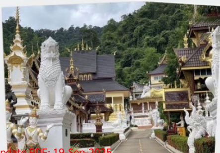
วัดไชยสถาน