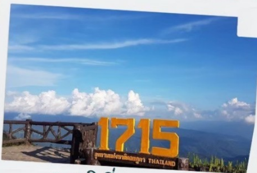
จุดชมวิวที่ความสูง 1715