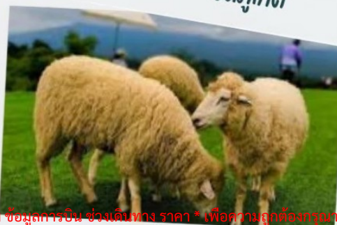
ฟาร์มแกะ