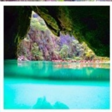
ดูปะการัง