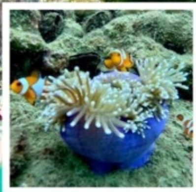
เที่ยวเกาะ