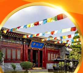
วัดก่วงเหริน