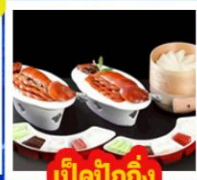
เปิดปิกกิ้ง