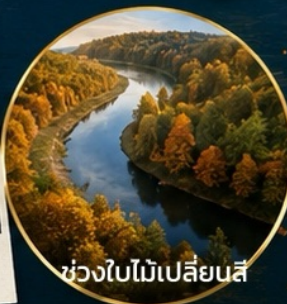
ช่วงใบไม้เปลี่ยนสี