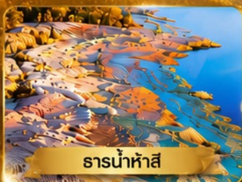
ธารน้ำห้ำสี่