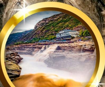
น้ำตกหูโข่ว