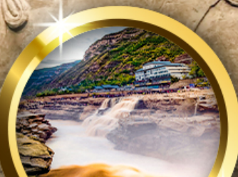
น้ำตกหูโข่ว