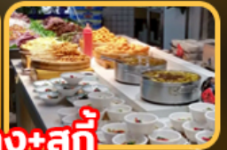
เปิดอย่าง+สุกั้