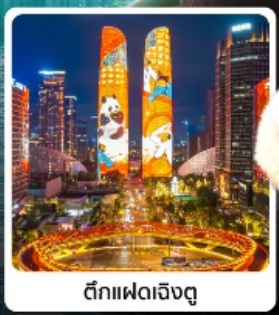
ตึกแฝดเจิงตุ