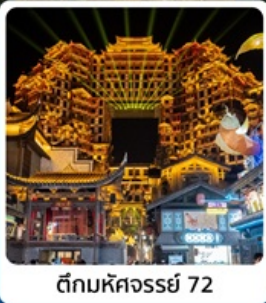
ตึกหัตถจารย์ 72