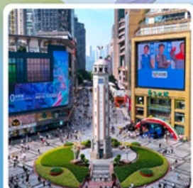
ถนนเจี่ยฟางเป่ย์