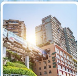
รถไฟทะลุถ้ำ