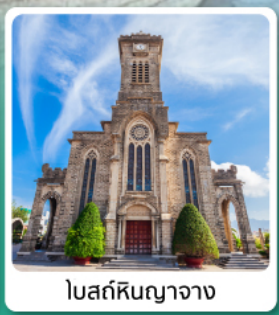
โบสถ์หินญากวาง