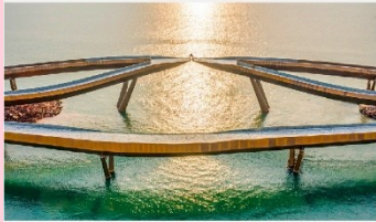
สะพานจูป