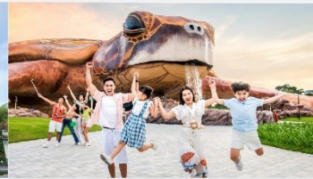
วินเพิร์ล อควาเรียม

*ทางบริษัทฯ ขอสงวนสิทธิ์ในการสลับโปรแกรมทัวร์ตามความเหมาะสมขึ้นอยู่กับสถานการณ์หน้างาน โดยคำนึงถึงผลประโยชน์ของลูกค้าเป็นสำคัญ