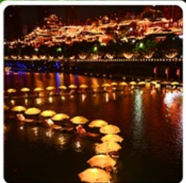
เมืองเซียนเอิน

• โฮเทล อุกยานเทียนเหมินชาน หุบเขาหวดาร์ เมืองโบราณเซียนเอิน หมู่บ้านโบราณฟูรงเจิน ภูเขาไร้ชาอู่เจียโด อุกยานซือจื่อกวานด่านสิงโต