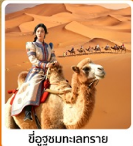
ซี่อูชมทะเลทราย

• โฮเทล เป็นทรายเป็นชาวาน แหล่งท่องเที่ยวระดับ 5A ของจีน แกรนด์แคนยอนแม่น้ำเหลือง ซี่อูท่ามกลางทะเลทราย