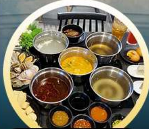
ซาบู้ฮ่องกง