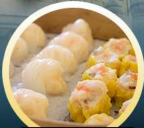
ต้มน้ำฮ่องกง