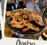
ปิ้งย่าง