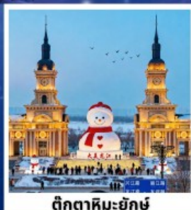
ตึกตาสหิมะยักษ์