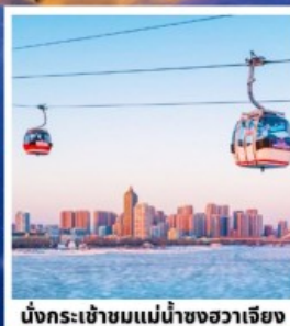
นั่งกระเช้าชมแม่น้ำชองฮวาเจียง