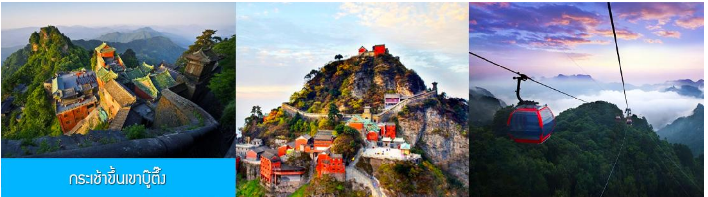
กระเช้าขึ้นเขาบู๊ตึ้ง

พักที่ WUDANGSHAN HOTEL ระดับ 4 ดาวห้องถื่นหรือเทียบเท่าในตำบลเขาบู๊ตึ้ง