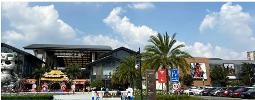
Shan Shan outlet