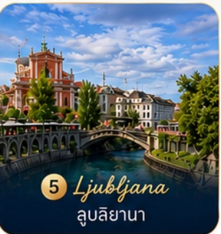
5 Ljubljana ลูบลิยานา