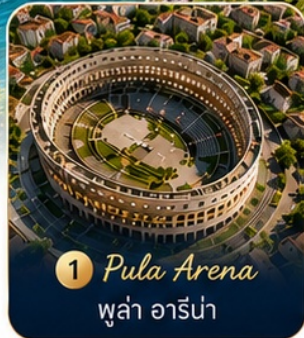
1 Pula Arena ปูลา อาร์น่า