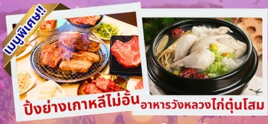
เมนูพิเศษ!! ปิ้งย่างเกาหลีไม่อื่น อาหารวังหลวงไก่ตุ๋นโสม บริการอาหารพรีเมียมทุกมื้อ

เซคอินเกาหลี สุดโรแมนติก ชมศิลปะดิจิทัลสุดล้ำ บนจอ LED เสมือนจริงขนาดยักษ์ สนุกสุดมันส์ สวนสนุกลิตเติ้ลเวิลด์ ชมต้นจูนีเปอร์เงินอายุกว่า 1,000 ปี และดอกไม้ตามฤดูกาล อิสระช้อปปิ้ง เมียงดง ช้อปปิ้งปลอดภาษี Lotte Duty Free