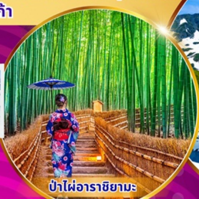
ป่าไฟอาราชิยามะ

พิเศษ! แอ้ออนเซ็น นั่งเคเบิลคาร์ ชมวิวภูเขาแอลป์