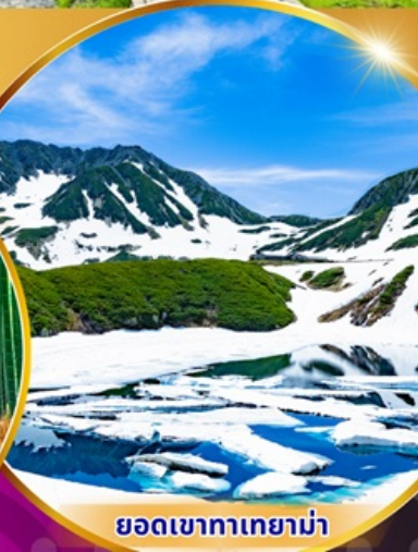
ยอดเขาทาเกยาม่า

พักโรงแรม 3 ดาว ★★★★★ ฟรี ประกันอุบัติเหตุ บริการอาหารท้องถิ่น