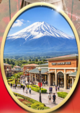
Gotemba Premium Outlets