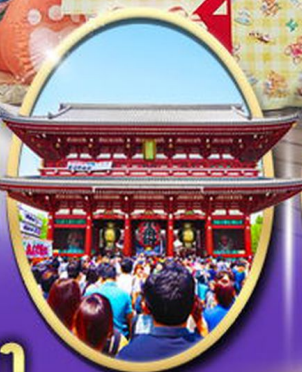
วัตินะเอโนชิมะ