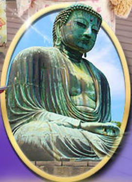
พระใหญ่คามาคุระ