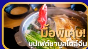
มือพิเศษ! บุปเป็ดชาบูสไตล์จีน