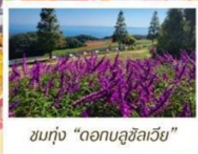
ชมทุ่ง "ดอกบลูซิลเวีย"