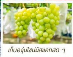
เก็บองุ่นไซน์มิสแคสตา ๆ

เที่ยวเกาะ - โอซาก้า (รวมบัตรเข้าสวนสนุก USJ)