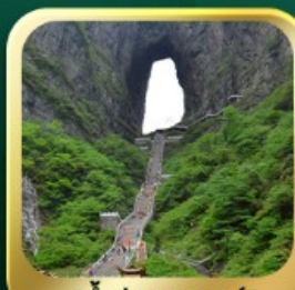
"กำประตูลิ่ว"