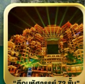
"ตึกมหัศจรรย์ 72 ชั้น"

นั่งกระเช้าชมภูเขาเทียนเหมินซาน • กำประตูลิ่ว • ทางเดินกระจก เมืองโบราณเฟิ่งหวง • เมืองโบราณฟูหลงเจิน • ชมโชว์จิ้งจอกขาว ภูเขาเทียนจื่อซาน (รวมลิฟต์แก้ว) • หุบเขาอวตาร • ตึกมหัศจรรย์ 72 ชั้น