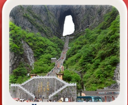
"กำประตูลิ่วหวง"