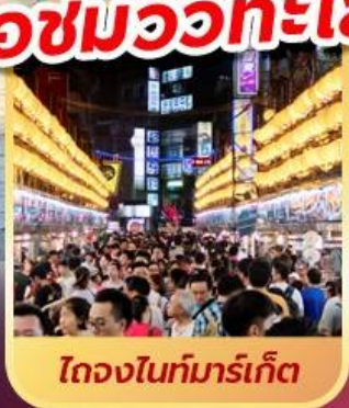
ไถจงไนท์มาร์เก็ต