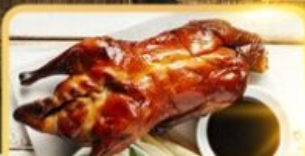
เปิด Four Season